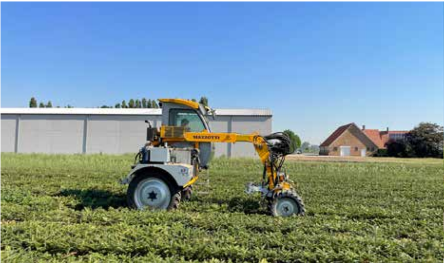
Werktuigendrager voor mechanische onkruidbestrijding Porte-outils pour contrôle mécanique des mauvaises herbes Tool-carrier for mechanical weed control

Sylva implements raising awareness actions in order to reduce introductions of invasive plants (see page 64)