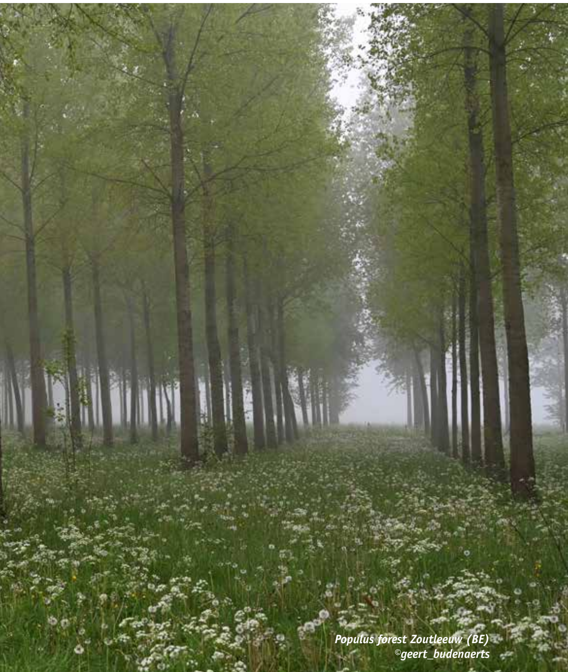
Populus forest Zoutleeuw (BE)