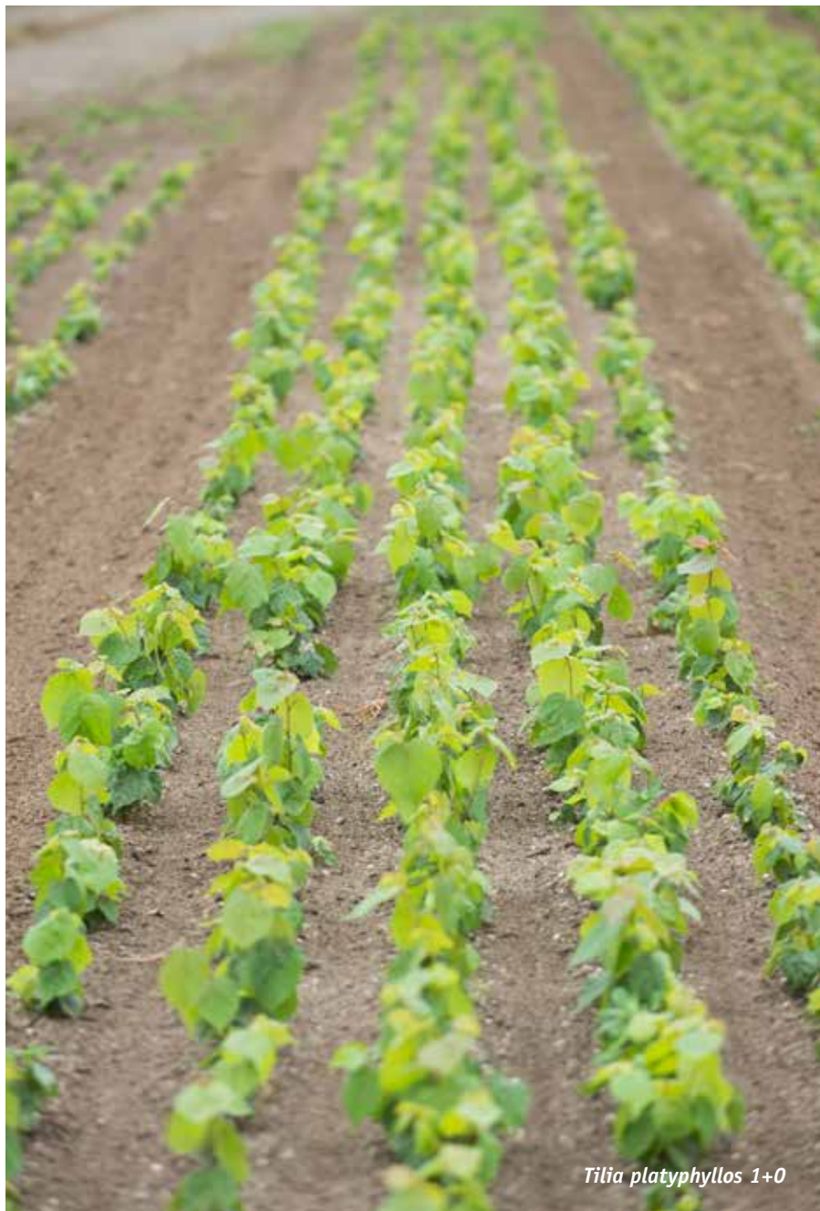
Tilia platyphyllos 1+0