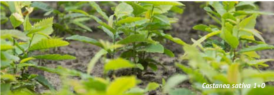
Castanea sativa 1+0