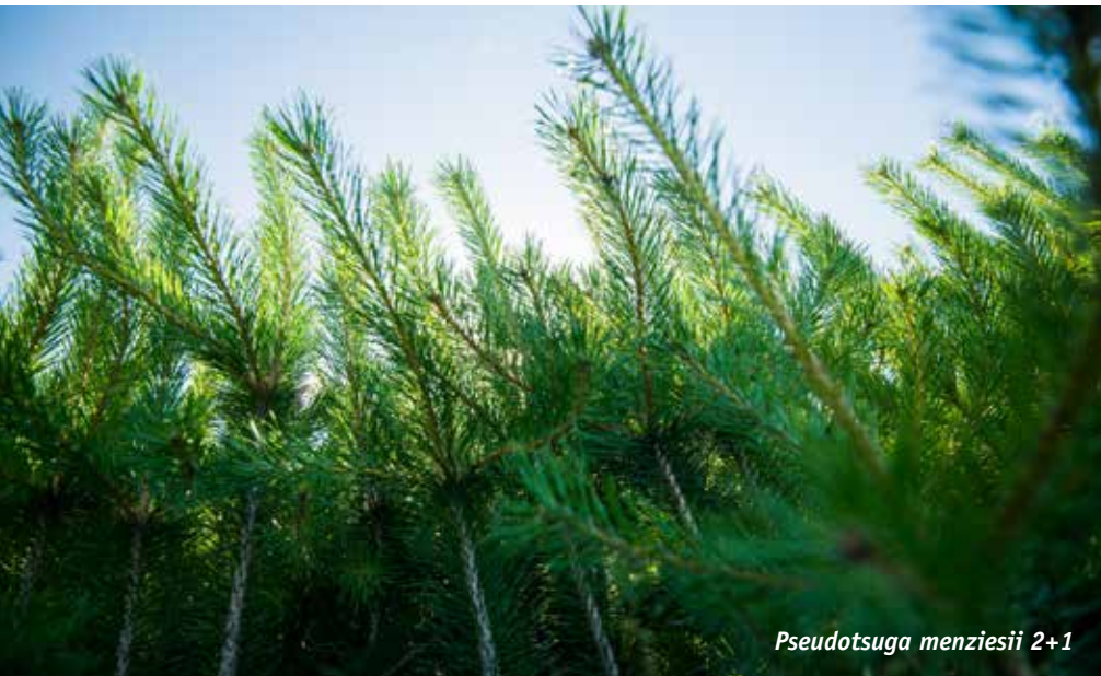
Pseudotsuga menziesii 2+1