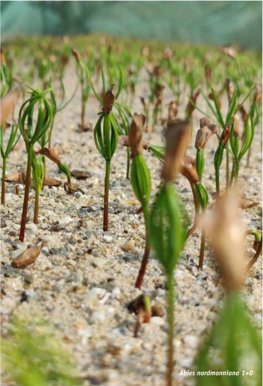
Abies nordmanniana 1+0