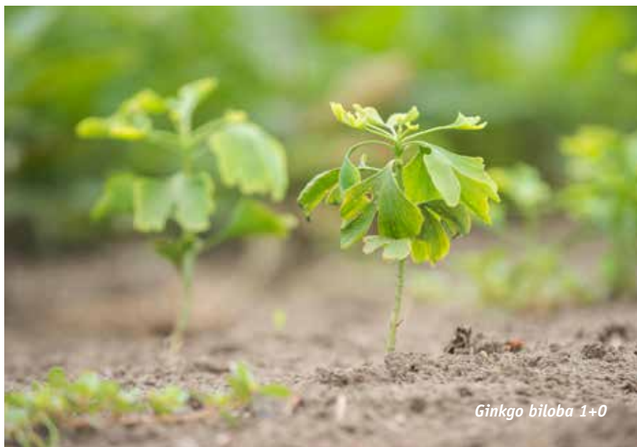
Ginkgo biloba 1+0